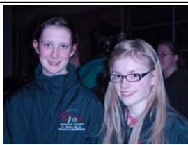
Everything because it's their first time competing.