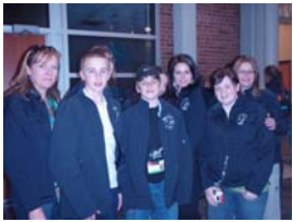
Trading pins with everyone, the banquets and definitely the tours!