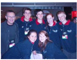
Meeting all Canadians!!

Q. What do you look forward to most this week?